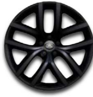
19" MIT 5 DOPPELSPEICHEN (STYLE 5136) GLOSS BLACK