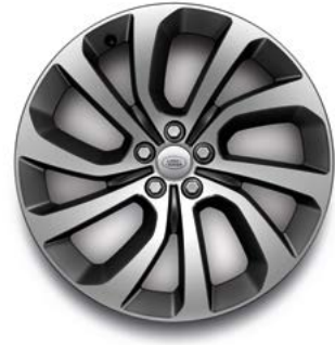
20" MIT 5 DOPPELSPEICHEN (STYLE 5089) GLOSS DARK GREY, CONTRAST DIAMOND TURNED