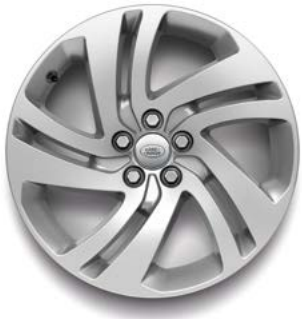
18" MIT 5 DOPPELSPEICHEN (STYLE 5074) SILVER Serienausstattung für S