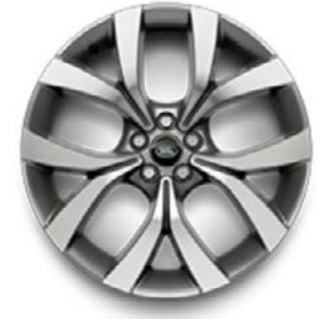
20" MIT 5 DOPPELSPEICHEN (STYLE 5076) 1 GLOSS MID-SILVER, CONTRAST DIAMOND TURNED Serienausstattung für Dynamic HSE