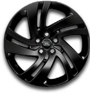
18" MIT 5 DOPPELSPEICHEN (STYLE 5074) GLOSS BLACK