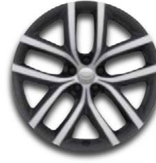
19" MIT 5 DOPPELSPEICHEN (STYLE 5136) GLOSS DARK GREY, CONTRAST DIAMOND TURNED Serienausstattung für Dynamic SE