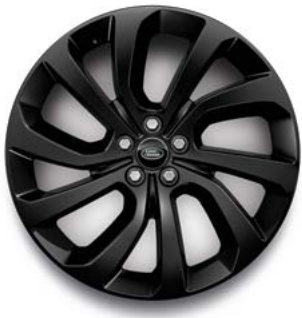
20" MIT 5 DOPPELSPEICHEN (STYLE 5089) GLOSS BLACK