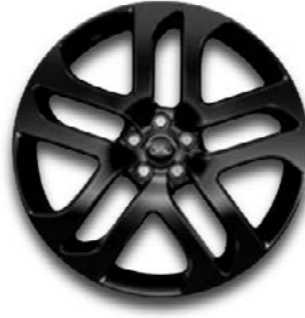
21" MIT 5 DOPPELSPEICHEN (STYLE 5078) 2 GLOSS BLACK