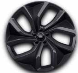
23" MIT 5 DOPPELSPEICHEN (STYLE 5128) DARK GREY, CARBON INSERTS