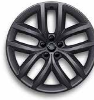
22" MIT 5 DOPPELSPEICHEN (STYLE 5127) SATIN DARK GREY Serienausstattung für Dynamic HSE