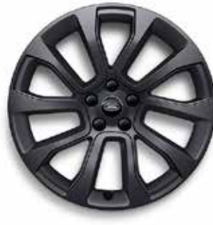
21" MIT 5 DOPPELSPEICHEN (STYLE 5126) SATIN DARK GREY Serienausstattung für Dynamic SE