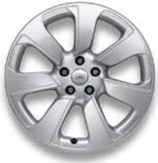
20" MIT 7 SPEICHEN (STYLE 7020) SPARKLE SILVER Serienausstattung für S