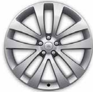
23" MIT 5 DOPPELSPEICHEN (STYLE 5135) SPARKLE SILVER