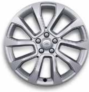
21" MIT 5 DOPPELSPEICHEN (STYLE 5126) GLOSS SPARKLE SILVER Serienausstattung für SE