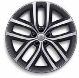
22" MIT 5 DOPPELSPEICHEN (STYLE 5127) SATIN DARK GREY CONTRAST, DIAMOND TURNED Serienausstattung für Autobiography