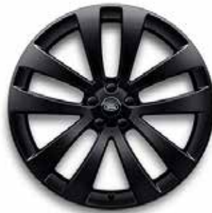
23" MIT 5 DOPPELSPEICHEN (STYLE 5135) GLOSS BLACK