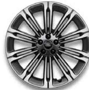
23" MIT 10 DOPPELSPEICHEN (STYLE 1075) GLOSS DARK GREY CONTRAST, DIAMOND TURNED