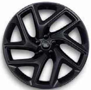
22" MIT 5 DOPPELSPEICHEN (STYLE 5131) SATIN BLACK, GLOSS BLACK CONTRAST