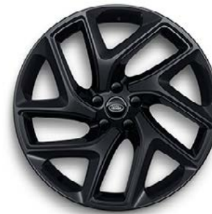
22" MIT 5 DOPPELSPEICHEN (STYLE 5131) 1 SATIN BLACK, GLOSS BLACK CONTRAST