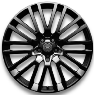
23" MIT 10 DOPPELSPEICHEN (STYLE 1084) 3 DUO TONE SATIN/GLOSS BLACK, GESCHMIEDET Serienausstattung für SV EDITION ONE - Obsidian Black