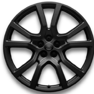
23" MIT 5 DOPPELSPEICHEN (STYLE 5132) 5 SATIN GREY TINT, CARBON Serienausstattung für SV EDITION ONE - Carbon Bronze