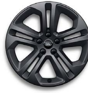
20" MIT 5 DOPPELSPEICHEN (STYLE 5125) 1,2 SATIN DARK GREY