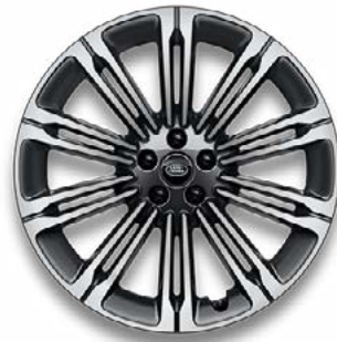
23" MIT 10 DOPPELSPEICHEN (STYLE 1075) 1 GLOSS DARK GREY CONTRAST, DIAMOND TURNED