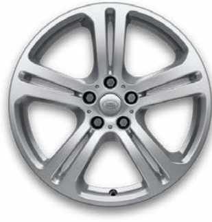
20" MIT 5 DOPPELSPEICHEN (STYLE 5134) 1,2 SPARKLE SILVER