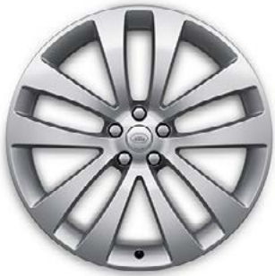
23" MIT 5 DOPPELSPEICHEN (STYLE 5135) 1,4 SPARKLE SILVER