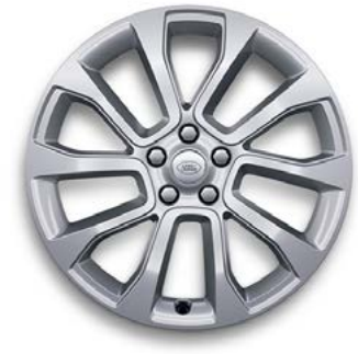
21" MIT 5 DOPPELSPEICHEN (STYLE 5126) 1 GLOSS SPARKLE SILVER Serienausstattung für SE