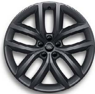
22" MIT 5 DOPPELSPEICHEN (STYLE 5127) 1 SATIN DARK GREY Serienausstattung für Dynamic HSE