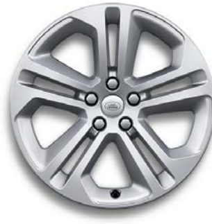
20" MIT 5 DOPPELSPEICHEN (STYLE 5125) 1,2 GLOSS SPARKLE SILVER Serienausstattung für S