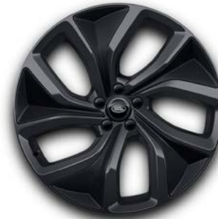
23" MIT 5 DOPPELSPEICHEN (STYLE 5128) 1 DARK GREY, CARBON INSERTS