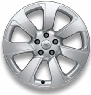
20" MIT 7 SPEICHEN (STYLE 7020) 1,2 SPARKLE SILVER