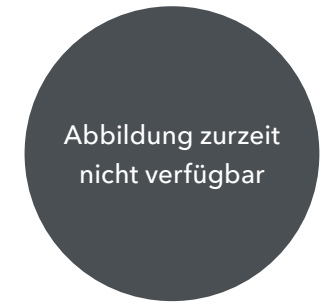
22" MIT 10 DOPPELSPEICHEN (STYLE 1083) 3 SATIN DARK GREY CONTRAST, DIAMOND TURNED