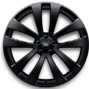
23" MIT 5 DOPPELSPEICHEN (STYLE 5135) 1 GLOSS BLACK