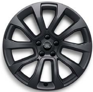
21" MIT 5 DOPPELSPEICHEN (STYLE 5126) 1 SATIN DARK GREY Serienausstattung für Dynamic SE