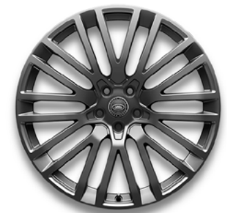
23" MIT 10 DOPPELSPEICHEN (STYLE 1084) 3 POLISHED DARK GREY, GESCHMIEDET Serienausstattung für SV EDITION ONE - Flux Silver