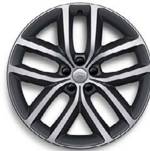
22" MIT 5 DOPPELSPEICHEN (STYLE 5127) 1 SATIN DARK GREY CONTRAST, DIAMOND TURNED Serienausstattung für Autobiography