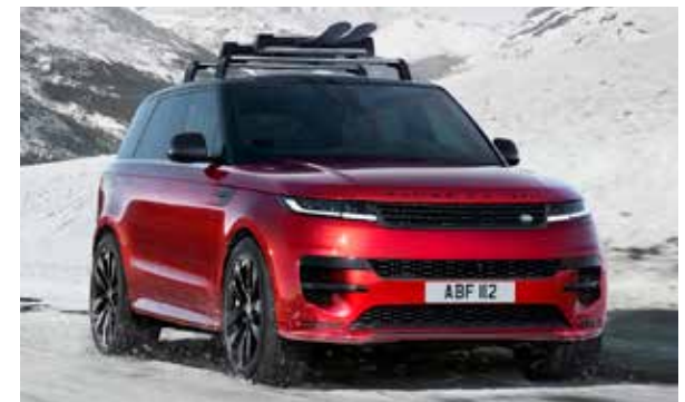
Ski- und Snowboard-Träger

*Die Preise verstehen sich als UVP inkl. 19% MwSt. und Montage bei Ihrem Vertragspartner. Preisänderungen vorbehalten.