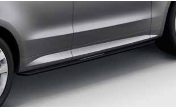
Feste Trittstufen – Schwarz