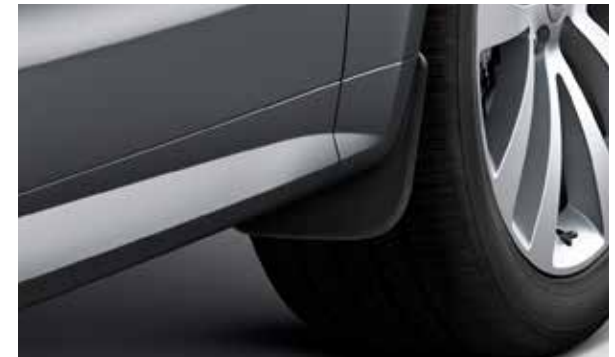
Schwarze Schmutzfänger vorne