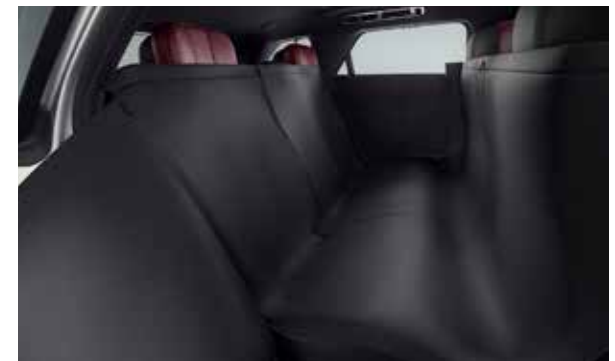
Sitzschonbezüge für die zweite Sitzreihe

*Die Preise verstehen sich als UVP inkl. 19% MwSt. und Montage bei Ihrem Vertragspartner. Preisänderungen vorbehalten.