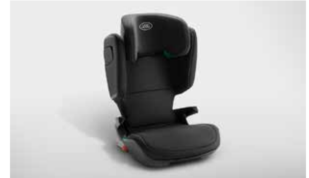
Kindersitz – Gruppe 2/3

*Die Preise verstehen sich als UVP inkl. 19% MwSt. und Montage bei Ihrem Vertragspartner. Preisänderungen vorbehalten.