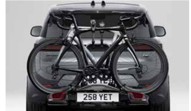
Fahrradträger für die Anhängerkupplung – für 2 Fahrräder