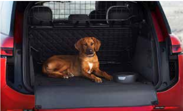
Haustier-Schutzpaket für den Laderaum