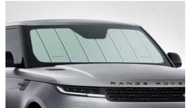
Sonnenblende für Windschutzscheibe