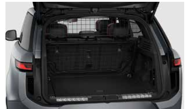
Laderaumabtrennung, volle Höhe

*Die Preise verstehen sich als UVP inkl. 19% MwSt. und Montage bei Ihrem Vertragspartner. Preisänderungen vorbehalten.