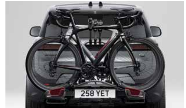
Fahrradträger für die Anhängerkupplung – für 3 Fahrräder