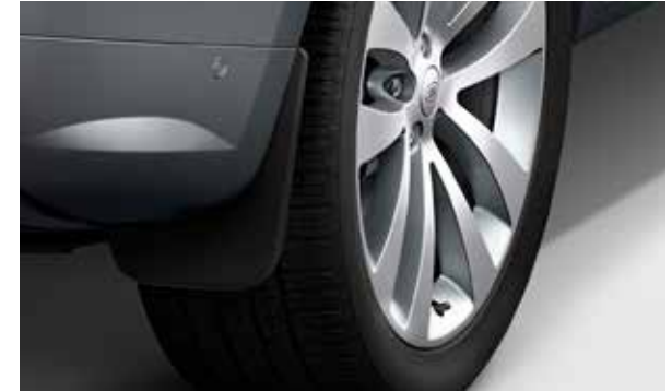
Schwarze Schmutzfänger hinten