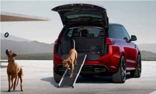
Haustier-Schutz- und Pflegepaket