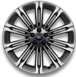
23" MIT 10 DOPPELSPEICHEN (STYLE 1075) 4 GLOSS DARK GREY CONTRAST, DIAMOND TURNED