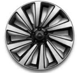
23" MIT 10 SPEICHEN (STYLE 1077) 3, 5 GLOSS DARK GREY CONTRAST, BRIGHT ATLAS SATIN INSERTS, DIAMOND TURNED, GESCHMIEDET