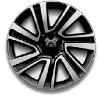
22" MIT 7 DOPPELSPEICHEN (STYLE 7023) GLOSS BLACK CONTRAST, DIAMOND TURNED