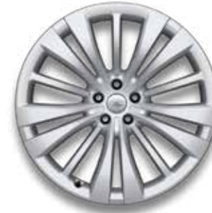
23" MIT 15 SPEICHEN (STYLE 1074) 4 SPARKLE SILVER