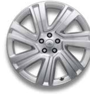
22" MIT 7 DOPPELSPEICHEN (STYLE 7023) SILVER Serienausstattung für HSE