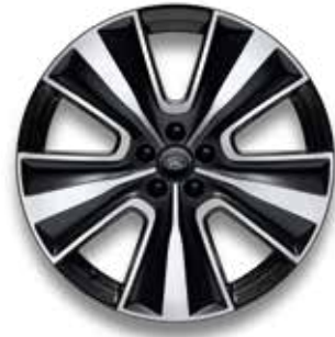
22" MIT 10 DOPPELSPEICHEN (STYLE 1072) SATIN BLACK CONTRAST, DIAMOND TURNED