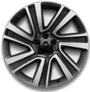
22" MIT 7 DOPPELSPEICHEN (STYLE 7023) 3 GLOSS DARK GREY CONTRAST, DIAMOND TURNED Serienausstattung für SV