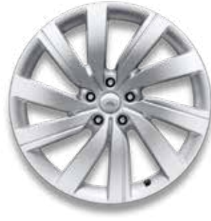
21" MIT 5 DOPPELSPEICHEN (STYLE 5112) SPARKLE SILVER Serienausstattung für SE