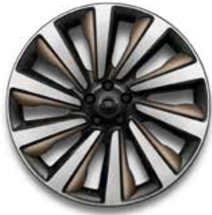
23" MIT 10 SPEICHEN (STYLE 1077) 3, 5 7 GLOSS DARK GREY CONTRAST, CORINTHIAN BRONZE INSERTS, DIAMOND TURNED, GESCHMIEDET