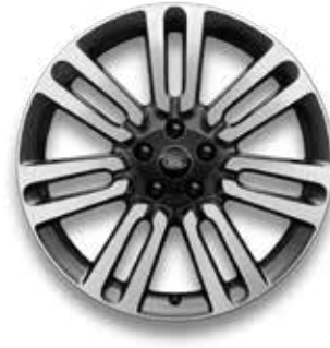
21" MIT 7 DOPPELSPEICHEN (STYLE 7021) GLOSS DARK GREY CONTRAST, DIAMOND TURNED