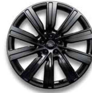
22" MIT 10 DOPPELSPEICHEN (STYLE 1073) GLOSS BLACK