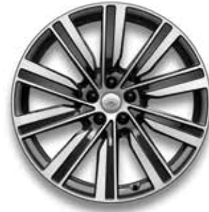
22" MIT 10 DOPPELSPEICHEN (STYLE 1073) GLOSS DARK GREY CONTRAST, DIAMOND TURNED Serienausstattung für Autobiography