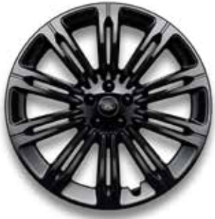
23" MIT 10 DOPPELSPEICHEN (STYLE 1075) 4 GLOSS BLACK