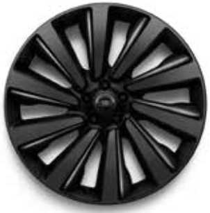
23" MIT 10 SPEICHEN (STYLE 1077) 3, 5 6 SATIN DARK GREY MIT SATIN BLACK CONTRAST UND NARVIK BLACK GLOSS INSERTS, GESCHMIEDET