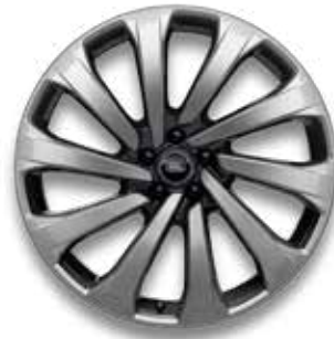
23" MIT 10 SPEICHEN (STYLE 1079) 4 SILVER MIT GLOSS DARK GREY CONTRAST, GESCHMIEDET